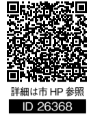
詳細は市HP参照 ID 26368