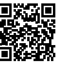
産業雇用安定センターHP

●キャリア人材バンク登録者募集 生涯現役社会の実現に向けて、高齢者の就業を支援します。66歳以降も働き続けたい方と、高齢者雇用に興味のある企業の方のご登録をお待ちしています。