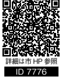
詳細は市HP参照 ID 7776