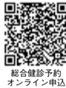
総合健診予約オンライン申込