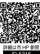
詳細は市HP参照 ID 5315

※年齢基準日:令和9年4月1日 ※年度内1回の受診となります ※予約状況によりご希望に添えない場合があります 【申込方法】健診日の2週間前までに、下記電話または申込フォームで受付