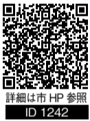
詳細は市HP参照 ID 1242