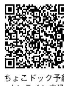
ちょこドック予約オンライン申込