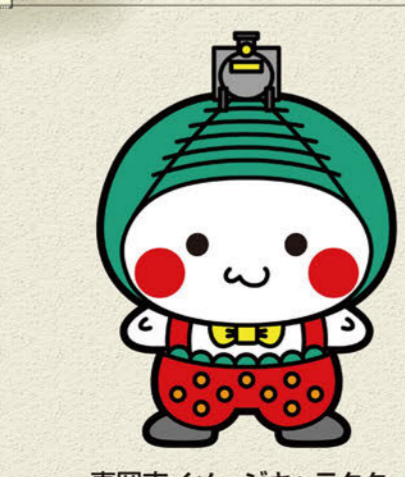
真岡市イメージキャラクター 「もかびよん」