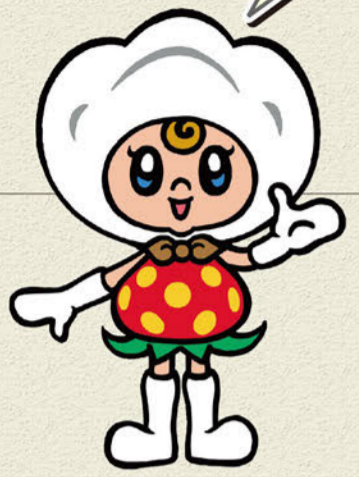
真岡市イメージキャラクター 「コットベリー」