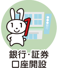
銀行・証券 口座開設