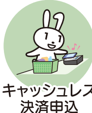
キャッシュレス 決済申込