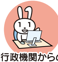
行政機関からの お知らせ・各種証明書