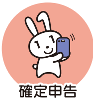
確定申告 (2024年度より)